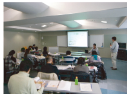
皆さん真剣に聞いて下さいました。

後日、主催者より参加者さんのアンケート結果をお聞きしましたが、90%のお客様が「面白かった」とお答え頂きました。おおむね好評だった様ですので第二回の計画も有るようですので興味をお持ちでしたら是非ご参加ください。