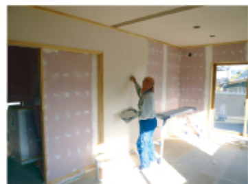
↑見事なコテさばきで塗り壁を仕上げました。