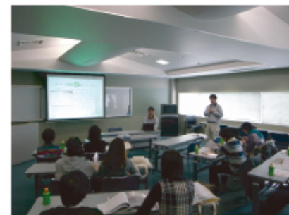
熱心な方が多かったですよ。

今回「第1回住まい研究所」に参加してみて感じたことは、これから家を建てようと思う方は様々な疑問点をお持ちだということでした。そこで、家造りにお役に立つセミナーや勉強会を今後、当社でも開催しようと計画中です。家造りの第一歩を踏み出す皆さんのお手伝いができるかと確信しています！開催の詳細が決まりましたら、当通信紙面にてお知らせしますので楽しみに！