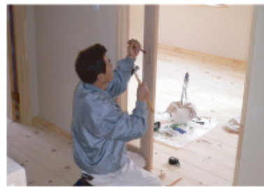
↑天然乾燥の天竜杉を使用したオリジナル建具を取付けました。