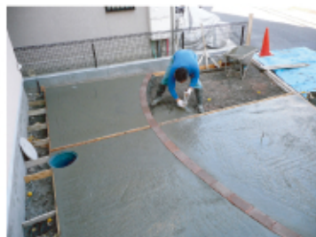
↑駐車スペースの工事の様子です。