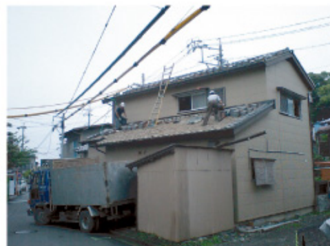
↑解体工事初日の様子です。安全第一で作業を進めています。