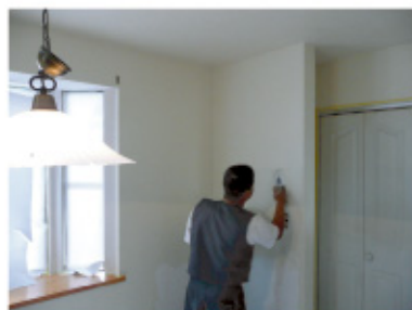
←そして仕上げ塗り！ウォールアーティストの技が光ります。