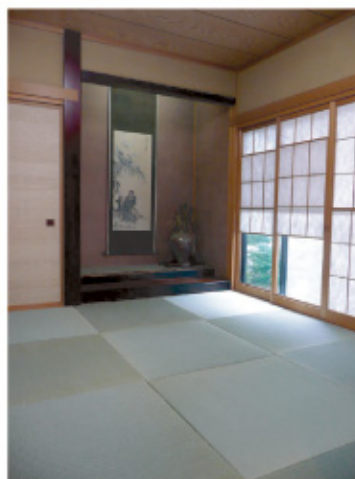
↑青々した畳と床の間の壁の色が絶妙に合っています。