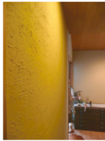
↑壁面のクローズアップ。光と影による絶妙な陰影が心癒されます。