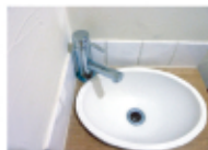
↑新しい蛇口に交換完了！