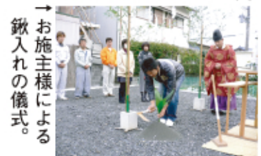
→お施主様による樹入れの儀式。