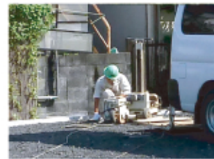
←地盤の強さを計測する地盤調査を行いました。