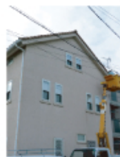
←高所作業車を利用して安全作業を行いました。