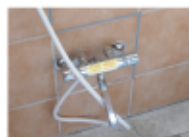
↑新しい水栓に交換完了！