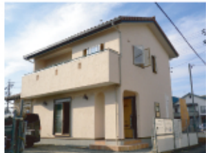
↑全景が見えました。素敵な色合いに仕上がりました。