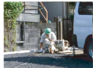
←地盤の強さを計測する地盤調査を行いました。