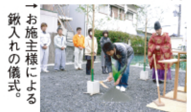
→お施主様による 鎮入れの儀式。